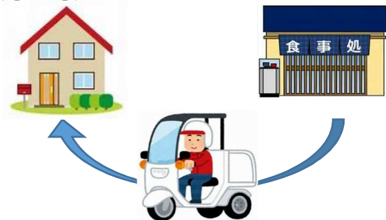
デリバリー、共同テイクアウトの実施